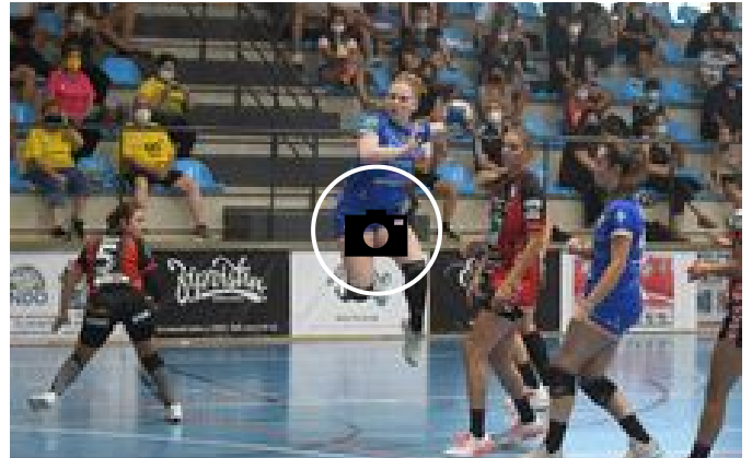
📷 Super Amara 32 - Zuazo 26