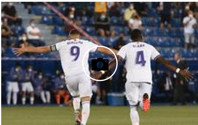
📷 Las mejores imágenes del Alavés-Real Madrid